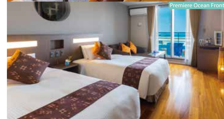
Premiere Ocean Front