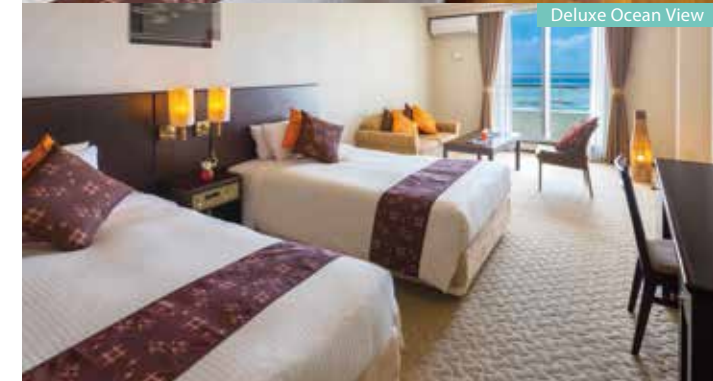
Deluxe Ocean View