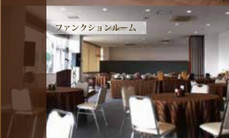
ファンクションルーム